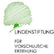
Lindenstiftung für vorschulische Erziehung