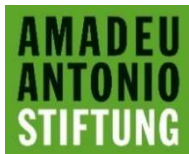
Amadeu Antonio Stiftung

Die folgenden Mitgliedsorganisationen des Netzwerks Kinderrechte zeichnen den Brief mit: