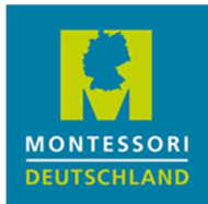
Montessori Bundesverband Deutschland e. V.