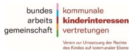
BAG Kinderinteressen e. V.