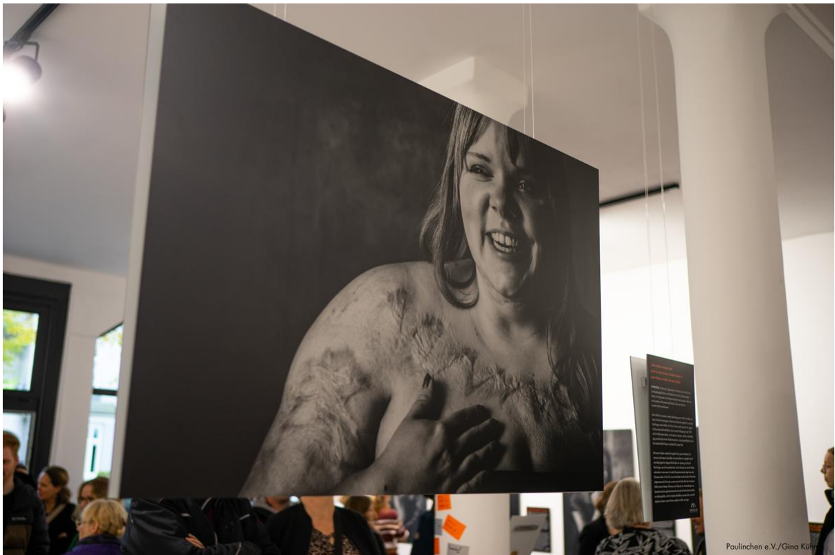
Paulinchen e.V./Gina Kühn